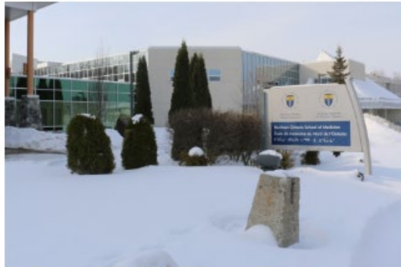
Northern Ontario School of Medicine, NOSM, NOSM University