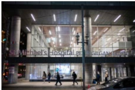
St. Michael's Hospital in Toronto, on Oct. 1, 2024. At the beginning of 2024, only one in 10 Ontario hospitals met the provincial target waiting time of eight hours for ER patients requiring admission, according to data The Globe and Mail obtained through an FOI request.

0 COMMENTS | SHARE | SAVE FOR LATER | GIVE THIS ARTICLE