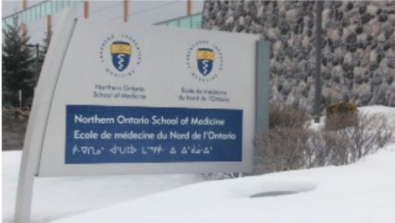
NOSM University, Northern Ontario School of Medicine